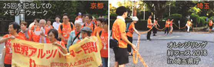
全国各地で、認知症支援のオレンジ色のライトアップもしています (写真は昨年度の様子)